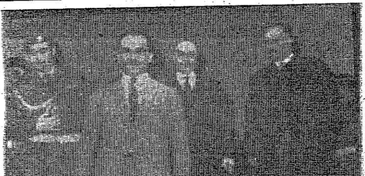
جلالة الملك المعظم يغادر دار رئاسة الوزراء بعد ان ترأس اجتماع المجلس

زار الحسين كلية الأركان عمان - قام جلالة الملك المعظم ظهر امس بزيارة كلية الأركان حيث اطلع جلالاته على سير العمل وتفقد مختلف الشكايات في الكلية ومبنيها وتجهيزاته وارصاداته السامية . يارينغ يصل لعمان في الاسبوع القادم عنان - صرح مصدر مسؤول كبير بان الدكتور غونار يارينغ المبعوث النرويجي الى الشرق الاوسط سيميل الى عمان في الاسبوع القادم لاستئناف البحث مع المسؤولين الاردنيين حول تنفيذ قرار مجلس الامن الدولي المتعلق باحلال السلام في المنطقة . وسيتوجه الدكتور يارينغ الى القاهرة بعد انتهائه من مهامه في عمان .